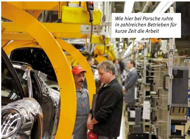
Wie hier bei Porsche ruhte in zahlreichen Betrieben für kurze Zeit die Arbeit

Beispiel unterstützt sie seit gut einem Jahr die Initiative "Respekt - Kein Platz für Rassismus", um in den Betrieben gegen Fremdenfeindlichkeit am Arbeitsplatz zu sensibilisieren.