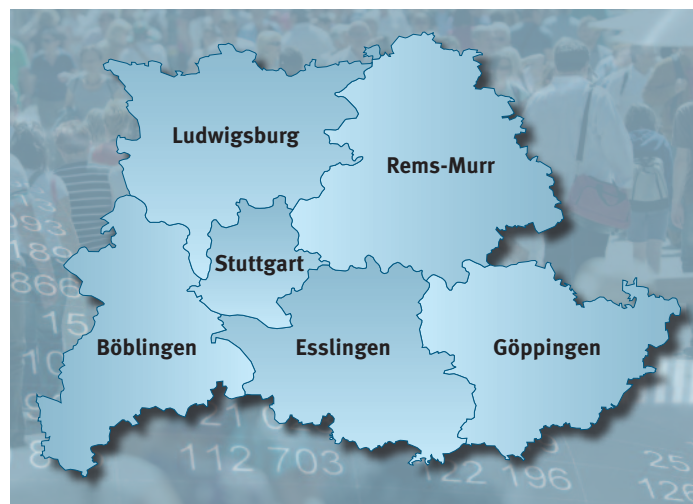
Die Region Stuttgart steht für 30 Prozent der Wertschöpfung im Land

Dabei sieht der Strukturbericht 2017 beste Voraussetzungen