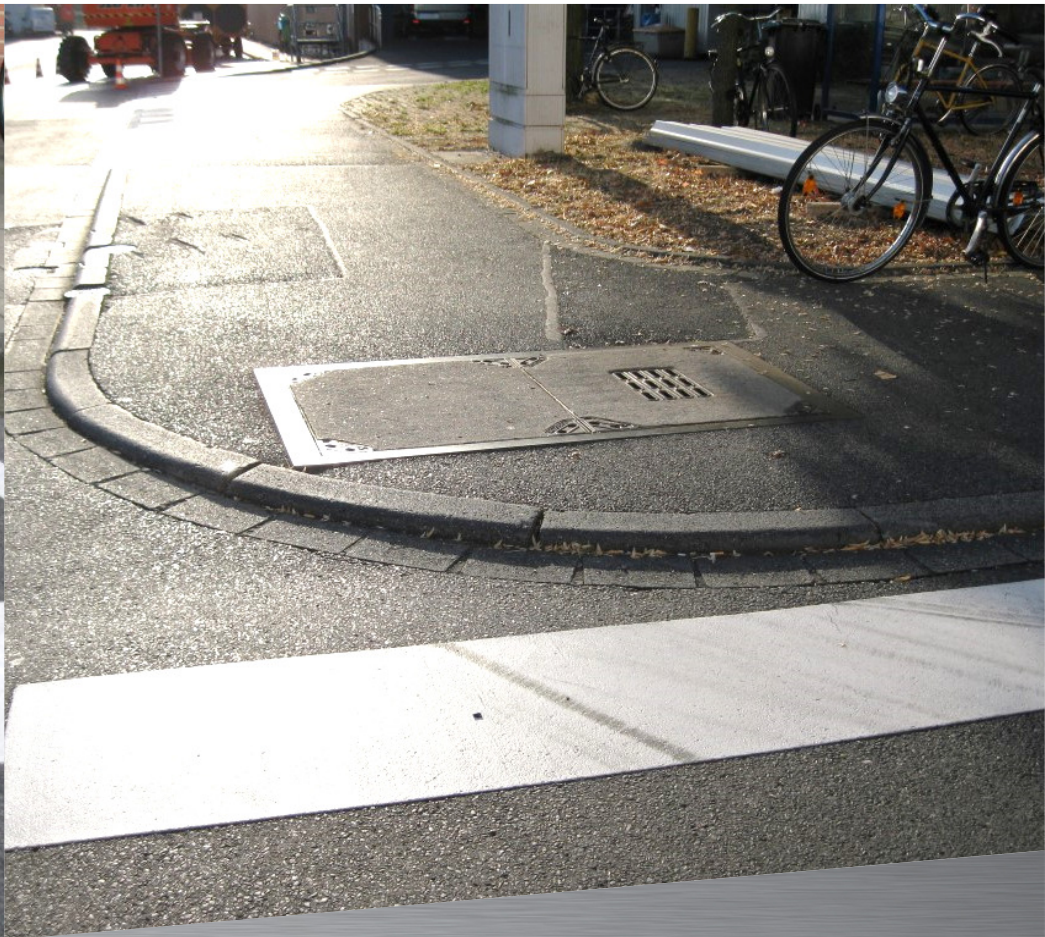
„G139 ING und Halle 180 Lack“