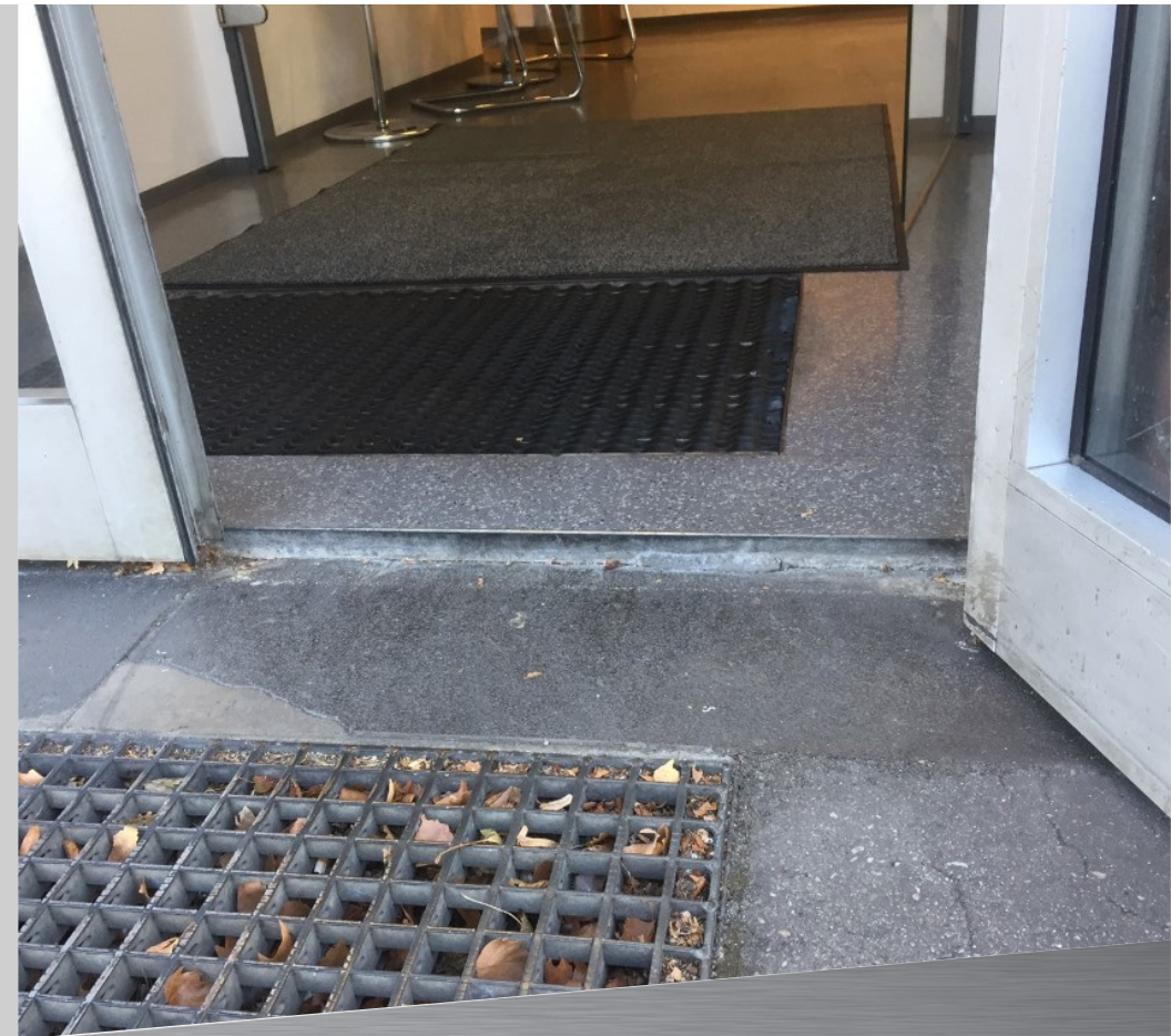
Daimler BKK Barriere