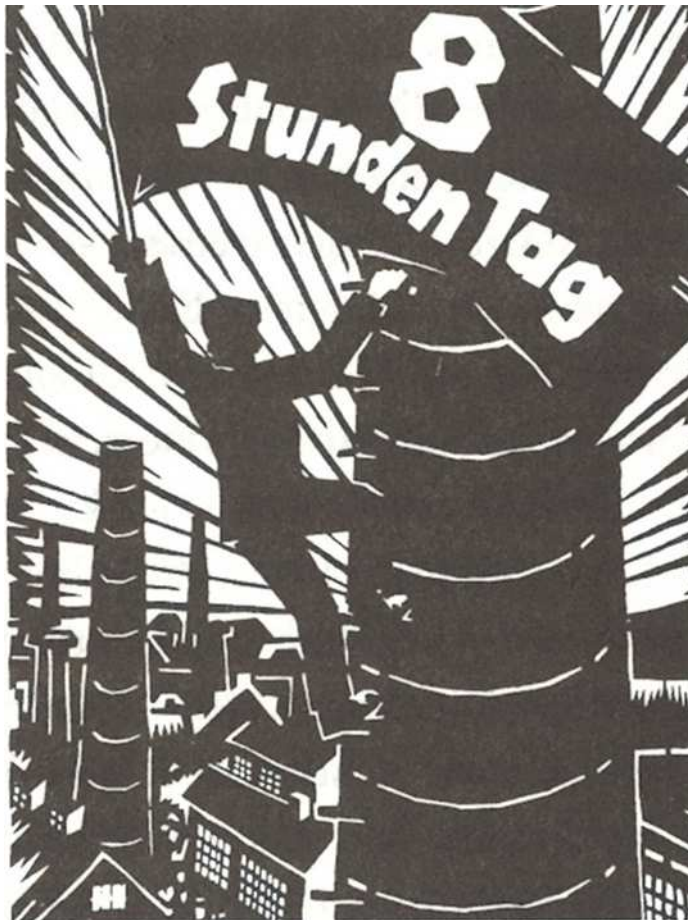
Werbung für den Achtstundentag, 1924