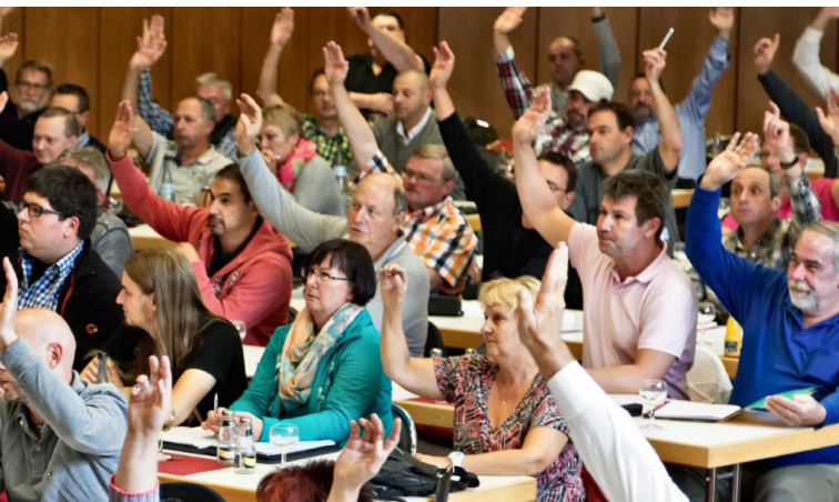
die Resolution zur Tarifrunde 2015

Das soll vor allem drei Berufsgruppen zu Gute kommen: An- und Ungelernte benötigen aufgrund von Lernhemmungen individuelle Förderung und finanzielle Unterstützung seitens der Politik. Berufsanfänger müssen an die Ausbildung ein Studium anschließen können, ohne ihre Stelle zu riskieren und ohne komplett auf Einkommen verzichten zu müssen. Und langjährige Beschäftigte brauchen Chancen zur beruflichen Neuorientierung samt der notwendigen tariflichen Aufstockung