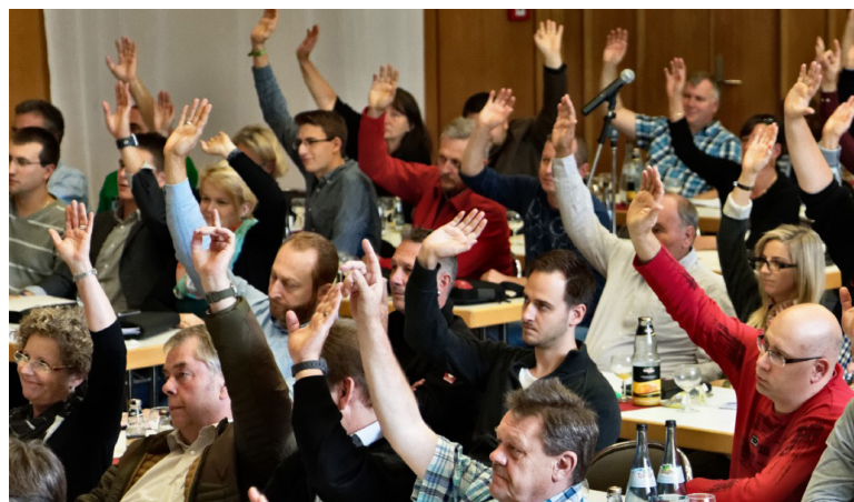
Einstimmig beschlossen: Die Große Tarifkommission bei der Abstimmung über...