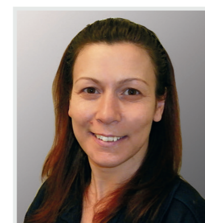
11 Eva Mendes 39 Jahre

"Ich möchte mich für eine gute Frauenpolitik stark machen!"