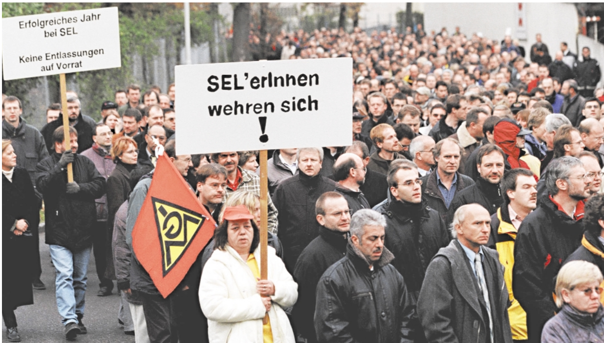
Demonstration bei Alcatel SEL: Es rumort wieder kräftig in Stuttgart-Zuffenhausen. Erneut sollen Stellen abgebaut werden – und das, obwohl die deutsche Alcatel SEL schwarze Zahlen schreibt, „auf Vorrat“. Das lassen sich die Beschäftigten nicht bieten. Sie wehren sich.

Erklärung der Großen Tarifkommission vom 29. November 2001 im Wortlaut